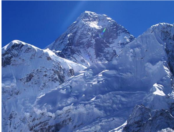
ה"אורסט" ממרחק 9.5 ק"מ

בטרק זה, הנוף המדהים, החוויות הרגשיות המסעירות והמרתקות, האתגר העצום והמפגש עם התרבות המקומית מפצים על כל המאמצים בדרך והחוויה היא חד פעמית ובלתי נשכחת.