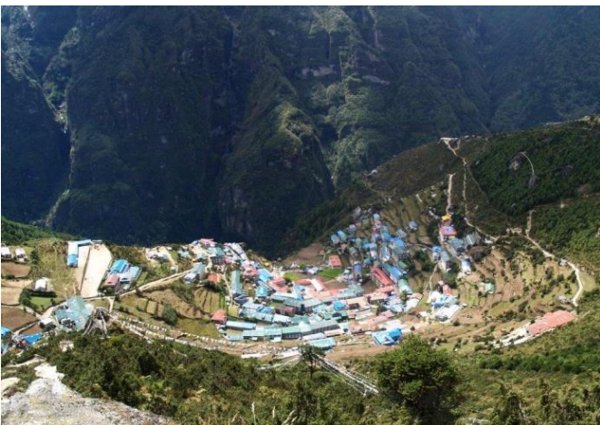
"נמצ'ה באזאר" 3,440 מטר

היום נטפס ליד הקרחון בנופים המדהימים של ההרים השגיאים בדרך הסלעית עד ל-צ'ו לה פאס. הדרך עוברת בעמק צר והעליה איטית והדרגתית. מצ'ו לה פאס נרד בזהירות לדזונגלה למנוחה המגיעה לנו.