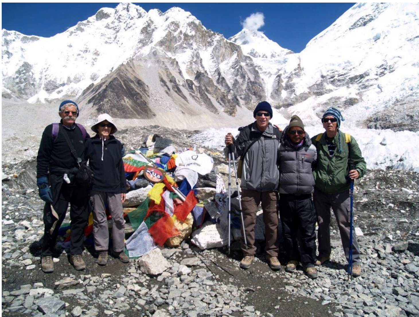
אוהלי הבייס קמפ מאחורינו 5,350 מטר

הטיול טרק יתקיים במתכונתו הנוכחית ברישום של 12 משתתפים לפחות.