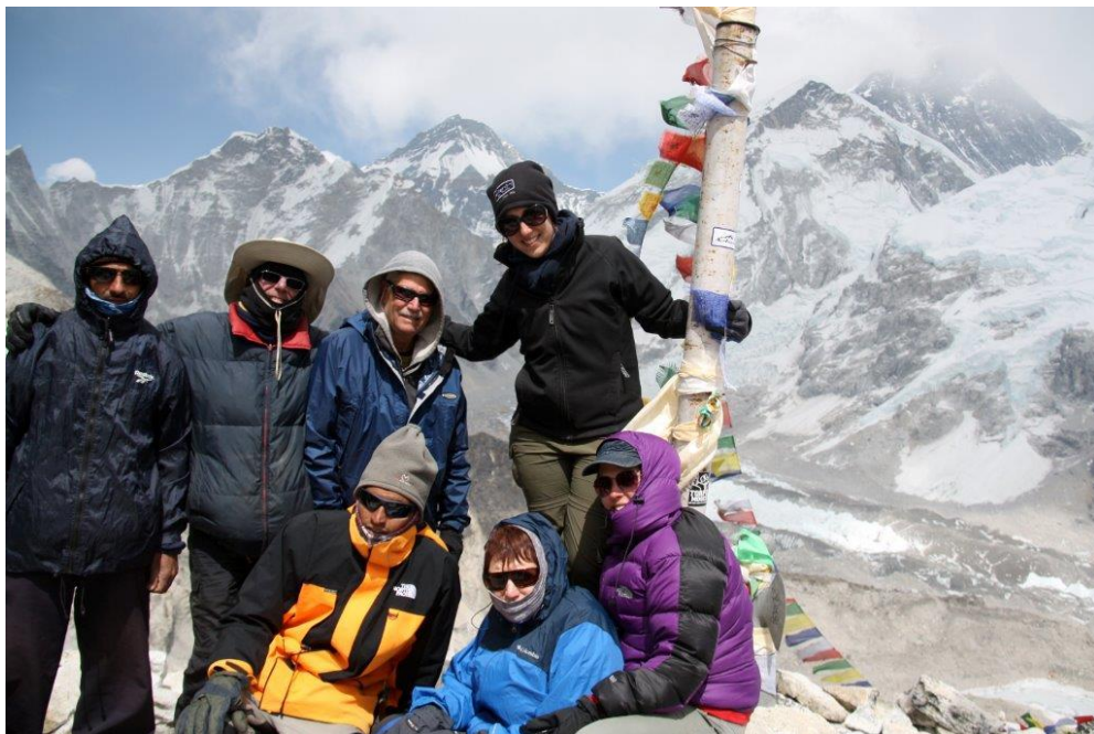
בפסגת קאלה פאטאר 5,545 מטר