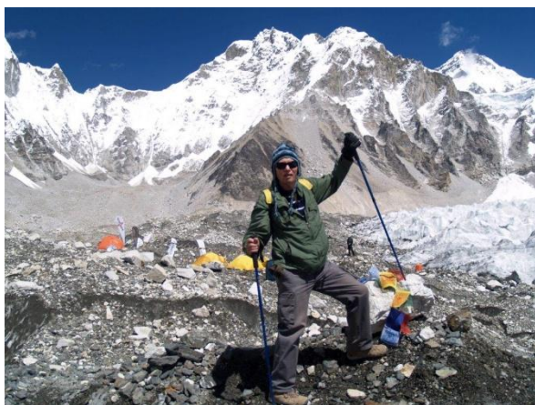
הגענו לביס קמפ

4. מידע על הטרק . מידע נוסף ניתן לקרא באינטרנט ו/או Lonely Planet - ב