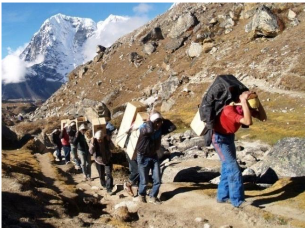
אספקה באחריות 5,000 מטר