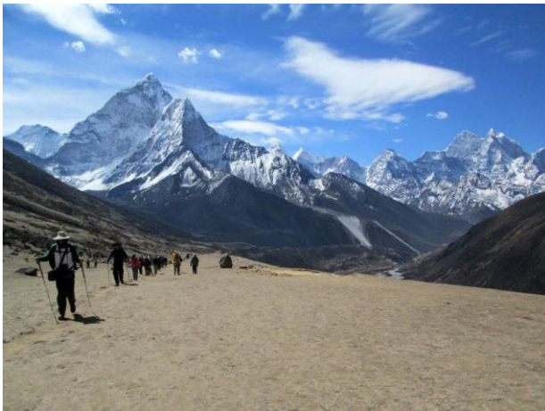
רמת טוגלה 4,620 מ'

ביטוח נוסעים , כולל: שינויים בלוח הטיסות, ביטולים עקב אירועי טבע, כח עליון, הנחיות רשויות וכו'. ארוחות צהרים וערב בקטמנדו. ארוחות צהרים בטרק. (כדאי להביא, פירות יבשים, אגוזים למיניהם, חטיפי אנרגיה, אפשר גם לקנות אוכל בדרך או לאכול במסעדה מקומית). מס יציאה מנפאל אם יידרש. שתייה בזמן הארוחות, כביסה, שיחות טלפון, קניות אישיות וכל שימוש או צורך אישי אחר. הוצאות נוספות כגון, לינות, ארוחות נוספות בקטמנדו ו/או בהרים, או כל הוצאה שהיא עקב יציאה ו/או חזרה מוקדמת או מאוחרת מקטמנדו לטרק ומהטרק לקטמנדו מכל סיבה שהיא.