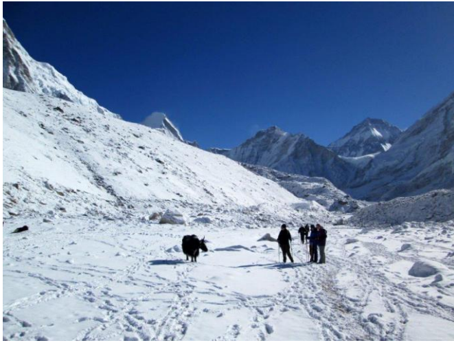
בדרך לבייס קמפ 5,300 מטר

של רועי עדרי היקים. לפנינו במרחב נראה את הפסגות מושלגות של: תמרסקו 6,623 מטר, קאנטגה 6,783 מטר ועוד שלל פסגות נוספות. מגיעים למצ'רמו 4,470 מטר.