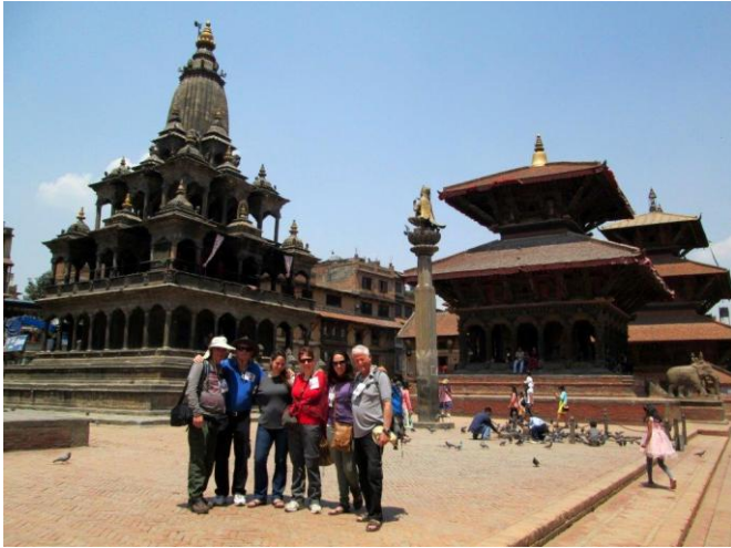
ב"פאטאן" בירת נפאל הקודמת