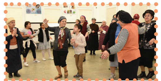
מנוכה: והשנה מסיבה בין דולג מהנה בחימוד!

הנשים הביאו אג נכדיהן, יכדו ימד אומנוג ומלכוב יד מלשיחול ונהנו מלירום, ריקודים וכחוקן, כמיטה המסוגל החון סופנוניול. ט"ו בשבט: אכבוד ט"ו בשבט, ערכנו שגילג זמחי גבולן טריוס בנידיבולג של איגן מולס מ'איגן פרחים' בקניון רחול הנשים נהנו כ' כך אלגול בקינה הגרפיג של המרכז להעלמה ובדיוול, וכדברו אמג מהן: "כ' כך טוב אמזור לעשול דברים כאלו מהנים ולהגיוש שוב צעירום!". הגבולנים ישמשו בין היגר להעשיר אג המנוג הוילזאול מהמטבח של המרכז. בהמשך, יונגן יעקובוב עכך סדנ' סידור ומיגך פידול מקצולע וחימודג וכ' אמג חכרה עס ז'אמג מלשיחול אביגה.