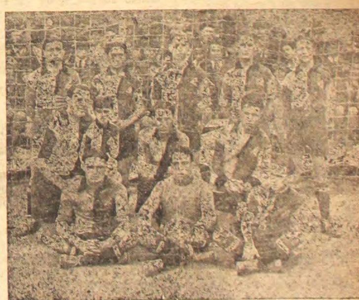
Club União Sportiva, dos Açores, que representará esta ilha na Semana Desportiva a realizar em Angra do Heroísmo por iniciativa da Liga de Educação Fisica.